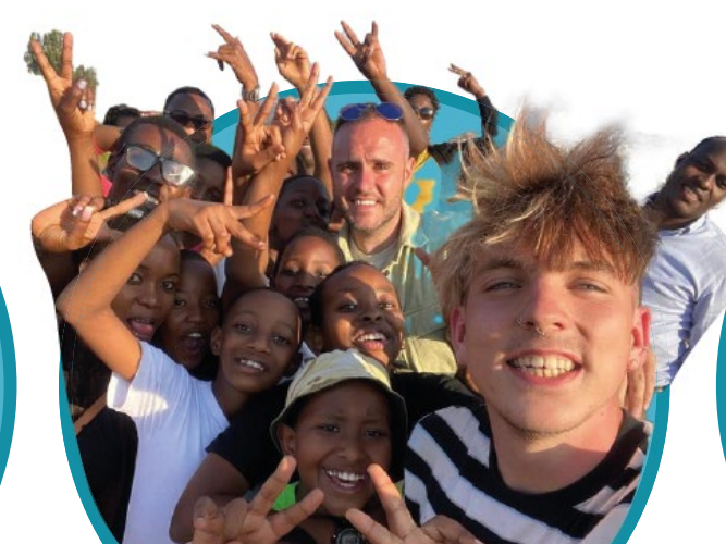
Giovani di tutto il mondo

Chef rinomato ed Eroe dell'Alimentazione