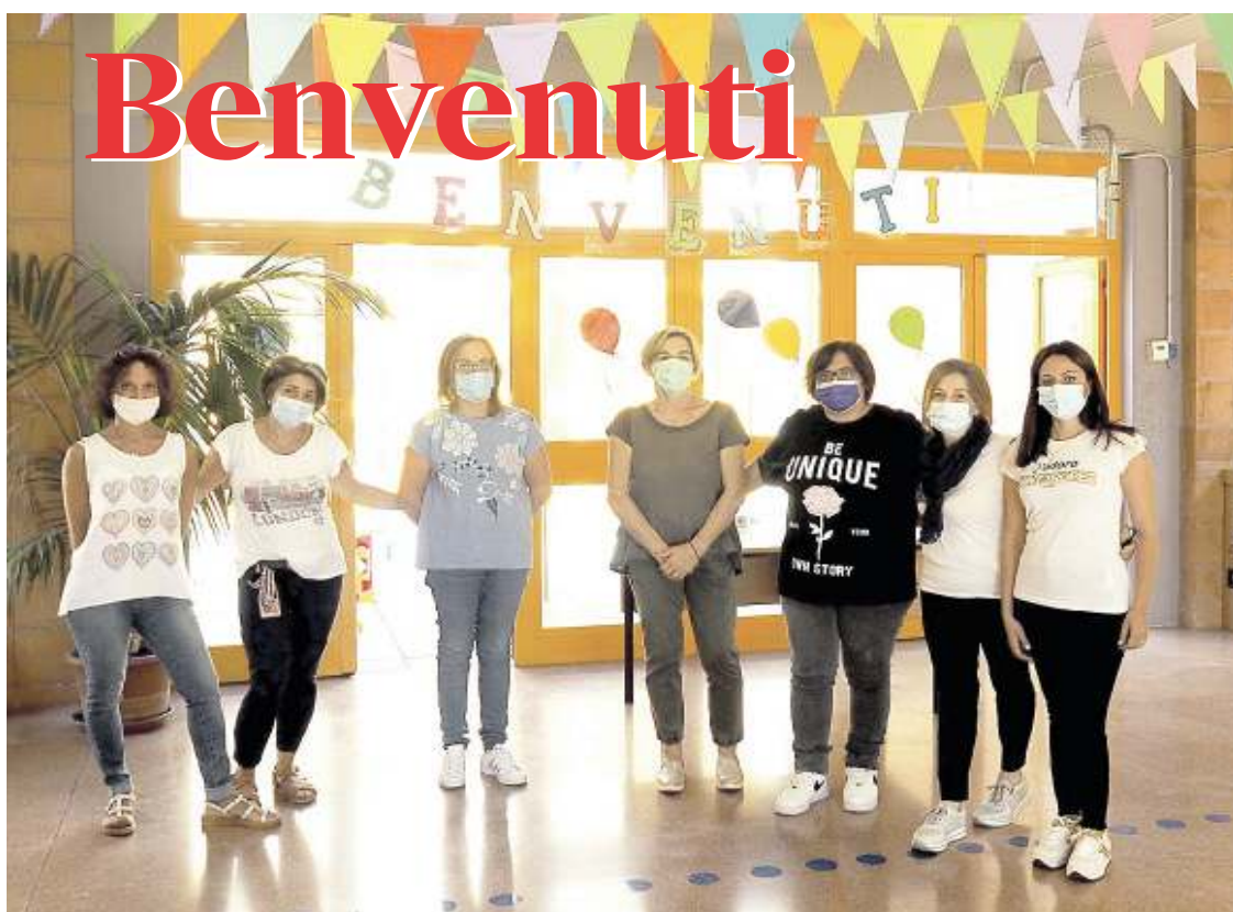
Un gruppo insegnanti del Ic Perugia 7

Scuola, la volata per il rientro in classe